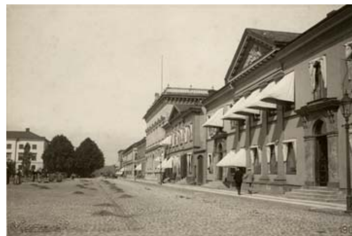
Ogränsning på torget år 1900.

Parkering skulle ske på torgets norra del med fören riktad inåt torget.