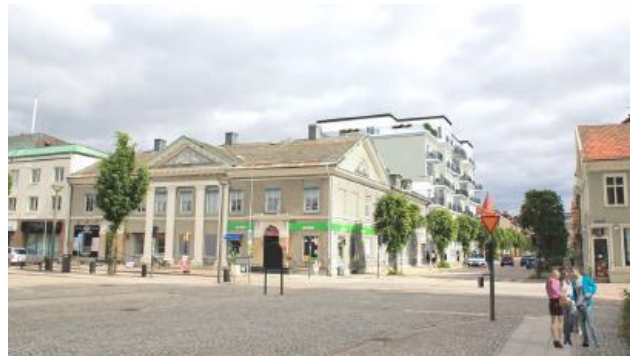
Vy från Edsgatan. Illustration med intilliggande byggnad med fullt utnyttjad byggrätt. Bild: Contekton Arkitekter

Planen beräknas behandlas av kommunfullmäktige 29 mars