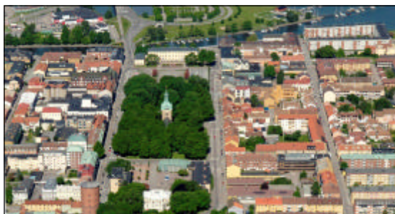
Centrala Vänersborg med Kulturaxeln.