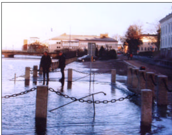
Översvämnning i centrala Vänersborg.