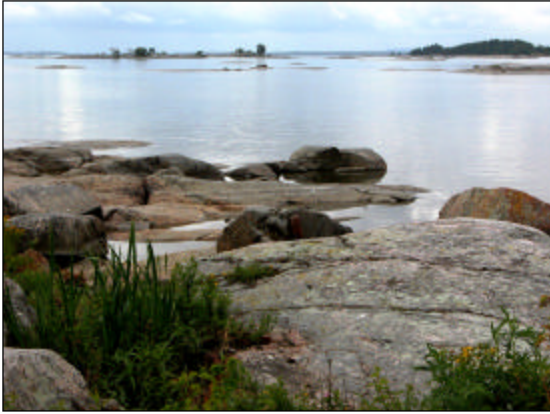
Vänerns norra udde.