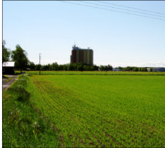
Silon i Brålanda.

Förändring inom området med bebyggelse eller anläggningar som minskar dess värde för framtida användning enligt ovan bör inte medges.