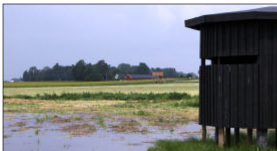
Gömslet för fågelskådare vid Hullsjön.

Ny bebyggelse eller anläggning som medför utsläpp till vattendragen medges inte.