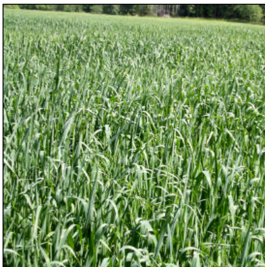
Havre = energi.

† Klimatinvesteringsbidrag (Klimp 2004) till effektivisering och utbyggnad av när- och fjärrvärme.