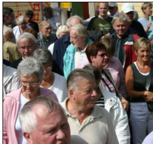
Perrongen vid järnvägsstationen.