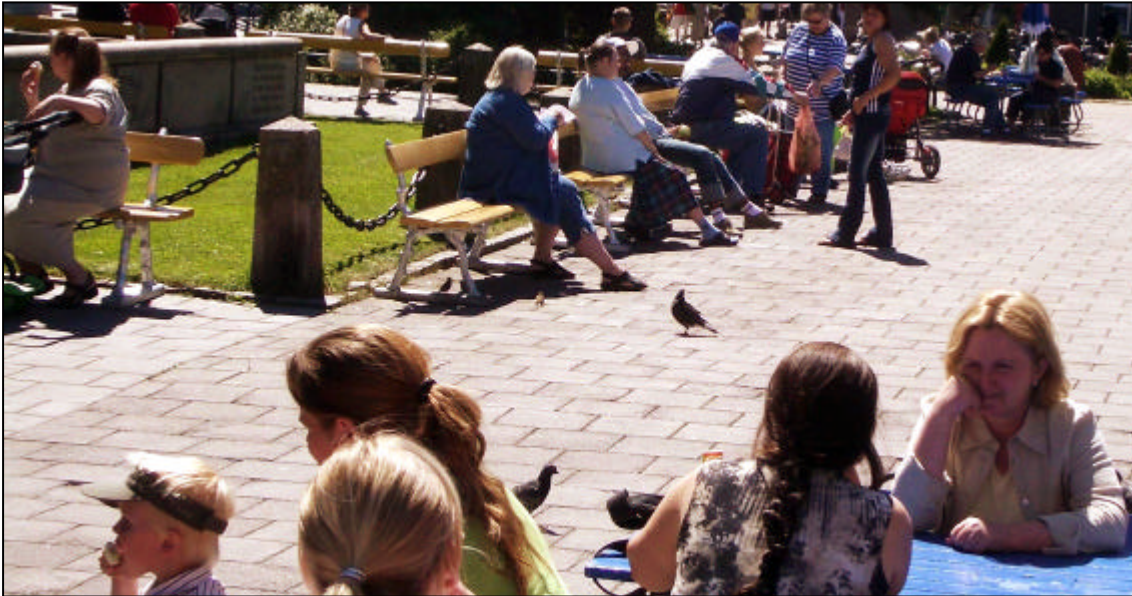
Torget i Vänersborg.