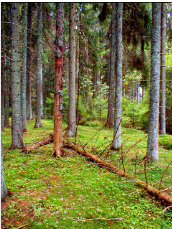
Tätorts nära skog i Dalbobergen.

Jakten har stor betydelse som fritidsaktivitet för många kommuninvånare. Den ger även markägare inkomster i form av jaktarrende eller vilt. Vårt kanske viktigaste område för jakt är Halle och Hunneberg som varit jaktområde för kungligheter sedan 1500-talet. Det är viktigt att goda viltstammar finns och förvaltas väl.