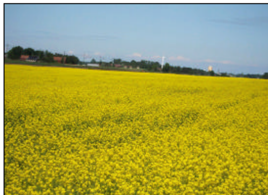
Rapsfält vid Nuntorp, Brälanda.

Jordbruksmark är av nationellt intresse och brukningsvärd jordbruksmark får tas i anspråk för bebyggelse eller anläggningar endast om det behövs för att tillgodose väsentliga samhällsintressen och detta behov inte kan tillgodoses på ett från allmän synpunkt tillfredsställande sätt genom att annan mark tas i anspråk (miljöbalkens hushållningsbestämmelser). Dalboslätten och slättmarkerna kring Västra Tunhem tillhör Sveriges mest bördiga jordbruksområden och