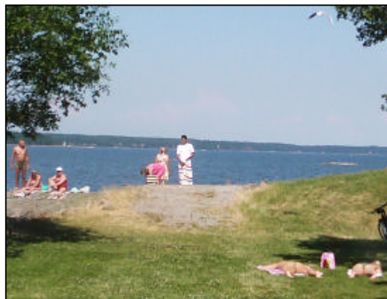
Platsen för Skräcklans ytvattentäkt.

■ Inga verksamheter som riskerar att förorena vattentäkterna får finnas inom skyddsområdena.