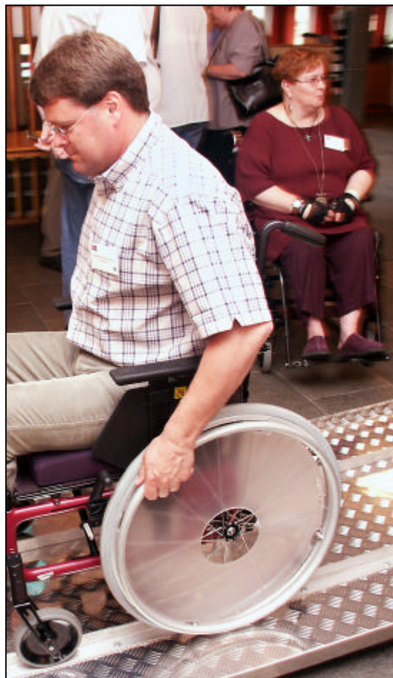
Deltagarna vid vänortsmötet 2003 fick testa olika lutningar på en rullstolsramp.

Kommunfullmäktige har antagit ett handikappolitiskt program 2001, som följs upp och revideras varje år. I detta har den politiska ledningen fastställt normer och synsätt som ska