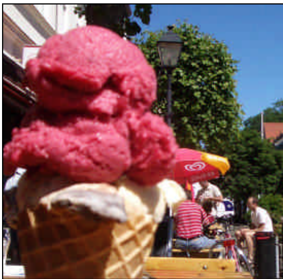
Fikastund med glass på gågatan.

Vänersborgs kommun antog 1997 ett lokalt handlingsprogram - en Agenda 21 för Vänersborg.