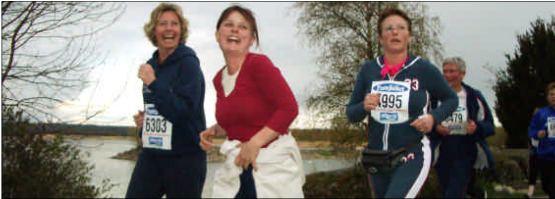
I maj varje år lockar Våruset i natursköna omgivningar vid Väneren runt 9 000 kvinnor.

samla de strategier och mål som finns antaget av kommunfullmäktige för miljöarbetet. Dessa har sorterats in under något av de för kommunen aktuella miljö kvalitetsmålen.