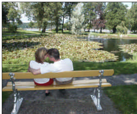
Förälskat par vid Skräcklan.

Under senare år har inriktningen på folkhälsoarbetet ändrats från att ha varit koncentrerat på att förhindra/minska beteenden, som utgör risk för hälsan, till att mer söka orsakerna till att ett sådant beteende uppstår. Ytterst handlar dagens folkhälsoarbete om att skapa jämlika och mer jämställda villkor när det gäller hälsan.