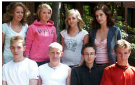
Sommarjobbade Agenda 21-ungdomar.

Kunskapsspridning och det lokala engagemanget är hörnstenar i ett kommunalt Agenda 21 arbete. Arbetet inom detta område sker kontinuerligt. Ett konkret exempel på årlig insats där temat är Agenda 21 och Folkhälsa är sommarjobb för ett tiotal ungdomar.