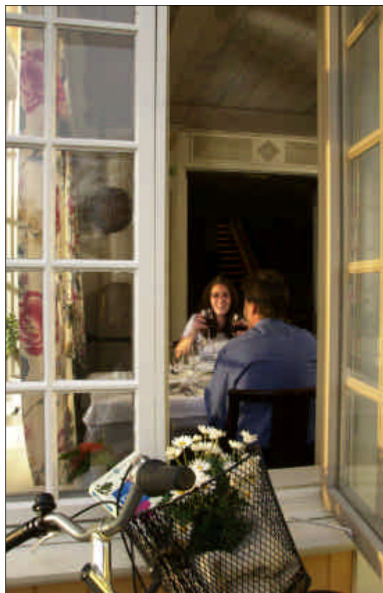
Paus under en cykeltur.