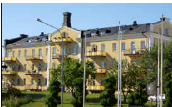
Det gamla fängelset har byggts om till bostäder.

Vid bedömning av områdena utmed Vänerkusten är utgångspunkten att kustområdena skall bestå som en resurs för friluftsliv och vattenanknutna verksamheter. Stor hänsyn tas till de natur- och kulturvärden som området besitter.