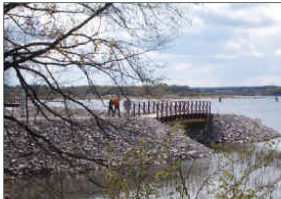
Gång- och cykelväg vid Strandkyrkogården.

av utbyggt vägnät och ledningar för vatten och avlopp, skolornas och förskolornas kapacitet, närhet till busslinjer och goda gång- och cykelstråk.