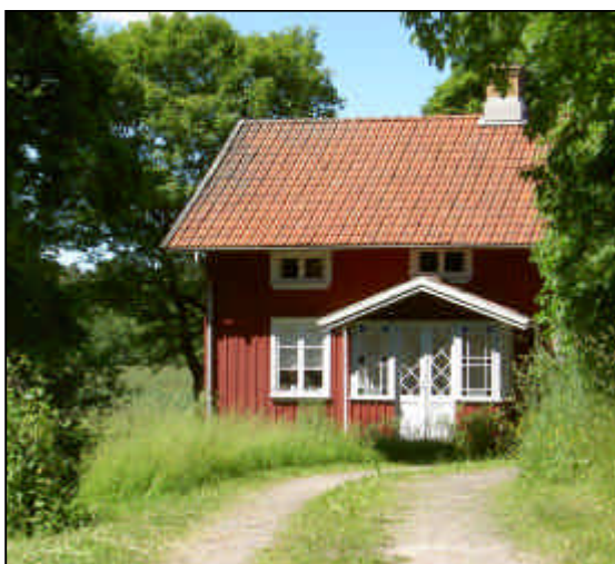
Hus i Skörbo, Frändefors.

I såväl Brålanda, Frändefors som Väner Ryr finns tillgång på tomter för bostadsbebyggelse.