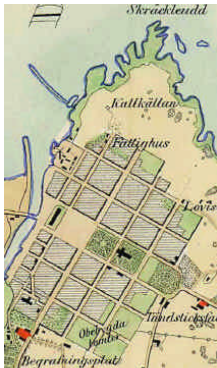
Rutnätsmönstret, kartdetalj från Kongl. General-Landtmäteri-Kontoret från 1856.

Stadens fortsatta bebyggelse skedde i tydliga årsringar med alltmer markkrävande utbyggnad