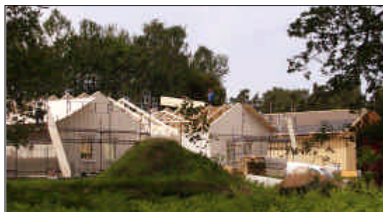
På Brinketorp byggs det...

der där de senaste sammanhängande bostadsområdena är bebyggelse på Onsjö från 1980-talet i söder och på Katrinedal från 2000-talets början på Blåsutsidan i väster.