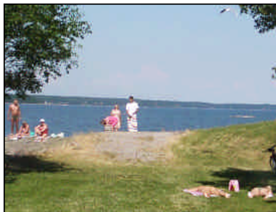
Platsen för Skräcklans ytvattentäkt.

■ Inga verksamheter som riskerar att förorena vattentäkterna får finnas inom skyddsområdena.