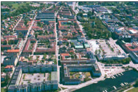
Flygfoto över centrala Vänersborg.

Residensstad präglad av 1600-talets stadsbyggnadspolitik och förändringar efter branden 1834 som gjorde staden till en förebild för det sena 1800-talets stadsbyggande.