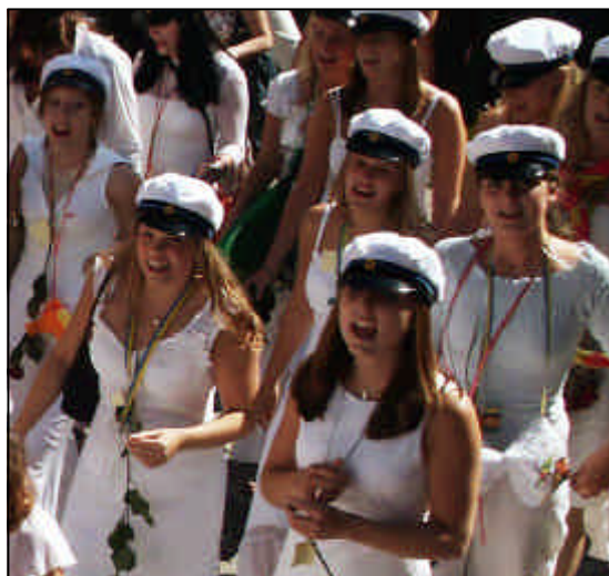
Studenter sjunger och tågar på gågatan.

Lagen om allmän förskola gäller från och med höstterminen då barnet fyller fyra år.