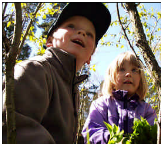
Barn på upptäcksfärd i Naturförskolan.

Nya styrdokument för skolan och nytt läraravtal har gjort att kraven på skollokaler förändrats. Skolbyggnaden får en helt annan roll i framtiden eftersom man använder olika metoder i undervisningen. Lokalernas funktionsduglighet och ändamålsenlighet måste ses över.