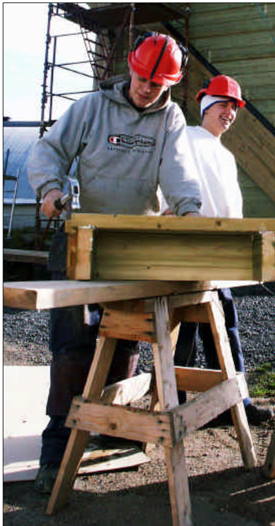
Elever från Birger Sjöberggymnasiet bygger den nya bandyläktaren.

Planera utifrån att skapa en trygg kommun att bo och arbeta i för alla medborgare.