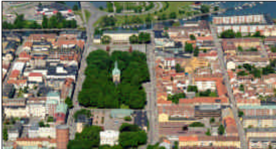
Centrala Vänersborg med Kulturaxeln.