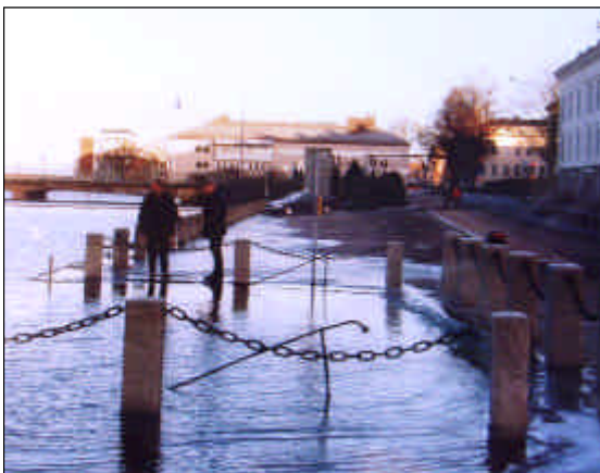
Översvämnning i centrala Vänersborg.