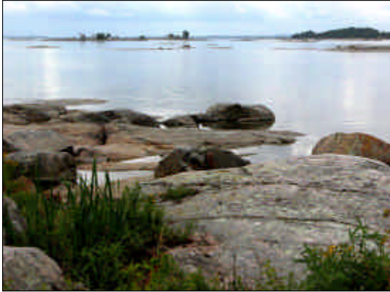
Vänersnäs norra udde.