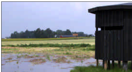
Gömslet för fågelskådare vid Hullsjön.

Ny bebyggelse eller anläggning som medför utsläpp till vattendragen medges inte.