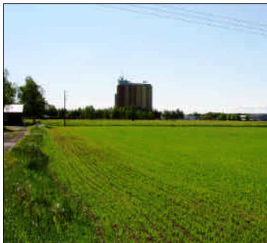
Silon i Brälanda.

De areella näringarnas intressen beaktas.