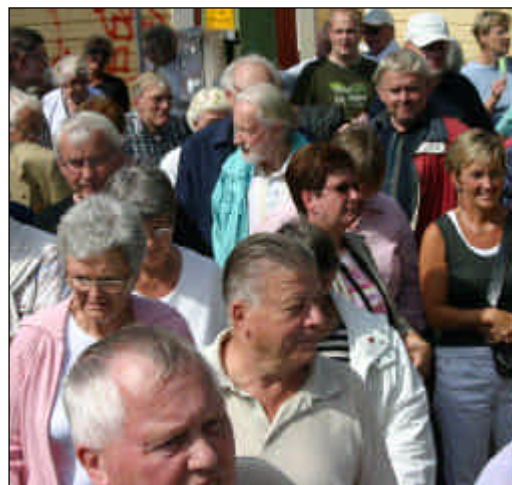
Perrongen vid järnvägsstationen.