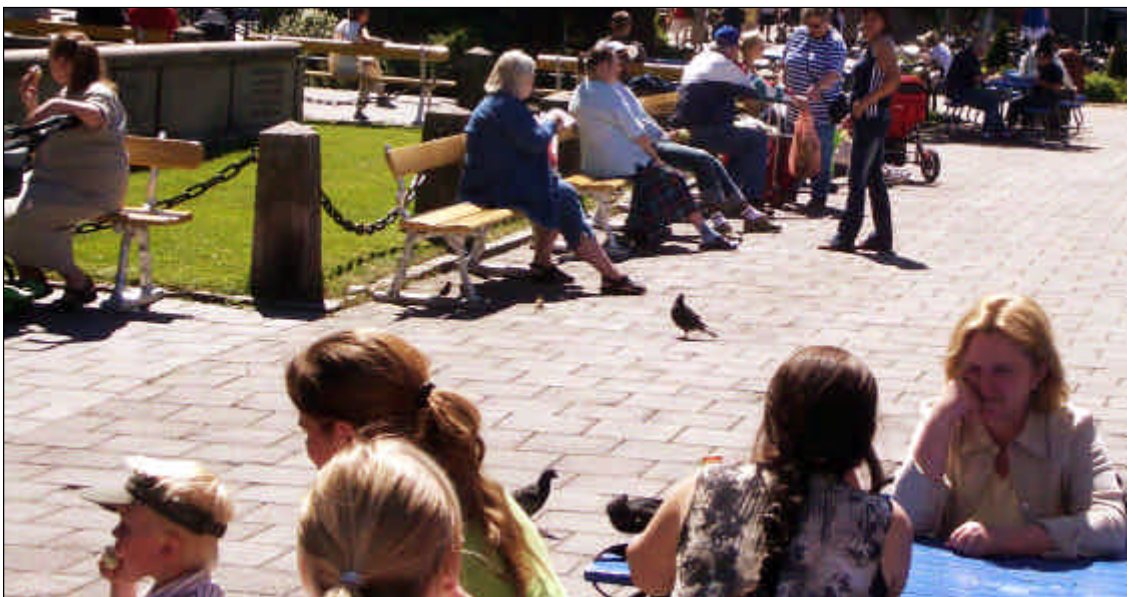
Torget i Vänersborg.