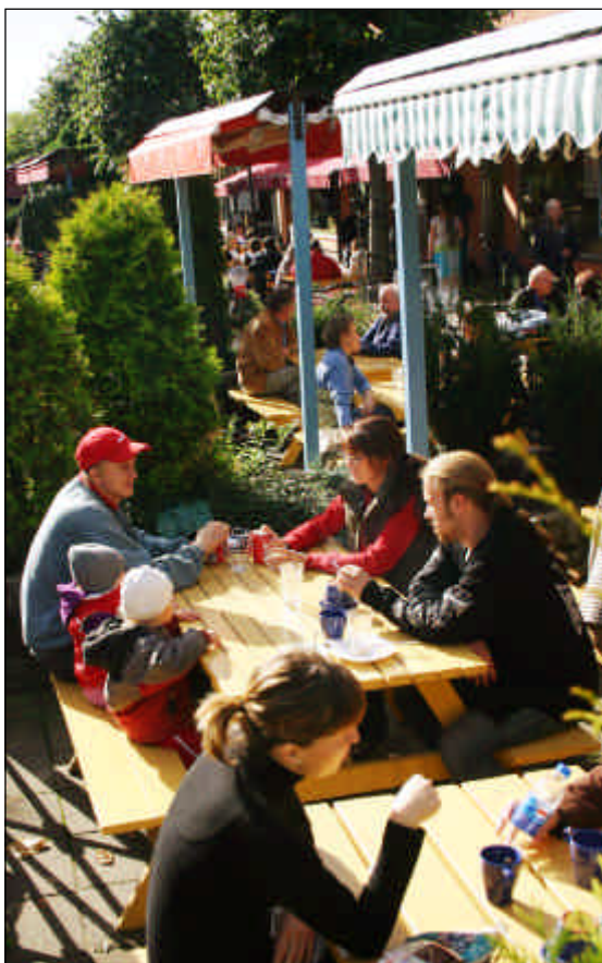
Fika på gågatan.

En tillväxt med ca 13 000 invånare fram till 2030 innebär ett hårdnande tryck på den kommunala servicen som befolkningsökningar i denna storleksordning innebär med tanke på att skatteintäkter släpar.