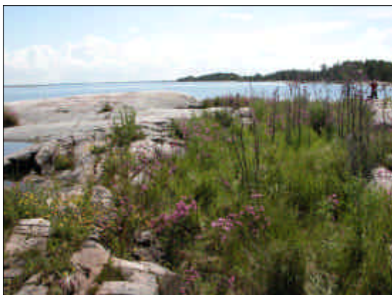
Vänersnäs norra udde.