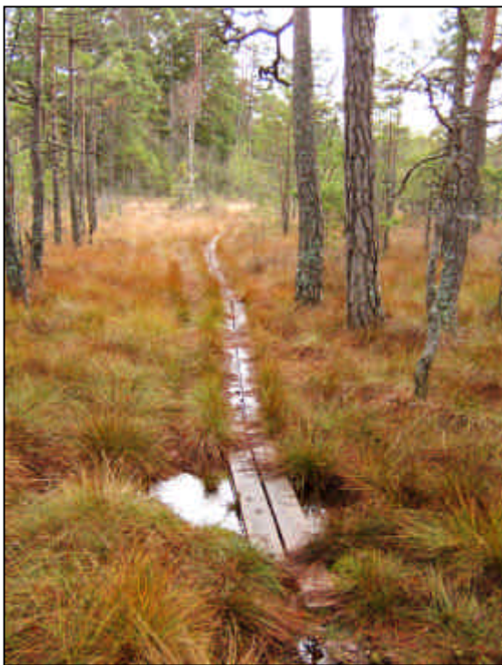
Spång över mosse.

Enligt rekommendationen i M2 och M3 skall mossarnas naturvärden bevaras.