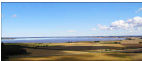
Södra Dättern med Floslätten.

Naturvårdens intresse prioriteras enligt rekommendation NR4. Större delen av området ingår i Natura 2000.