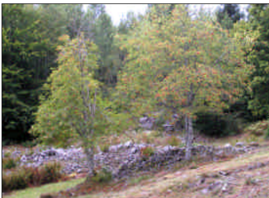
Fornborgen på Halleberg.

1500- och 1600-talet och efter Vassända medeltidskyrka.