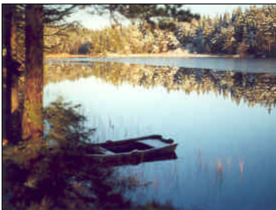
Sjö på Kroppefjäll.