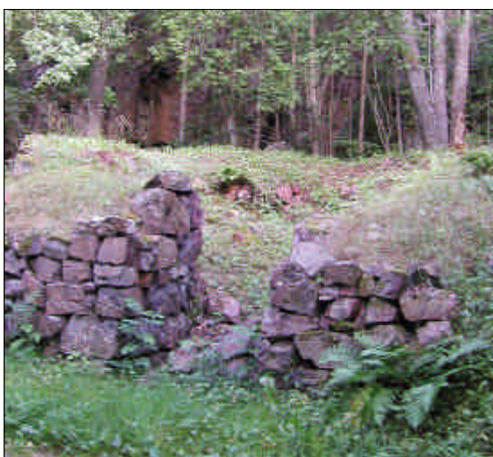
Lämning av kalkugn vid Tunhem.