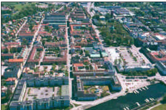
Flygfoto över centrala Vänersborg.

Residensstad präglad av 1600-talets stadsbyggnadspolitik och förändringar efter branden 1834 som gjorde staden till en förebild för det sena 1800-talets stadsbyggande.