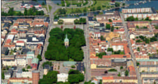
Centrala Vänersborg med Kulturaxeln.