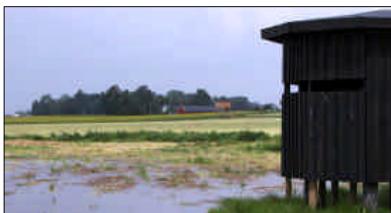
Gömslet för fågelskådare vid Hullsjön.

Ny bebyggelse eller anläggning som medför utsläpp till vattendragen medges inte.