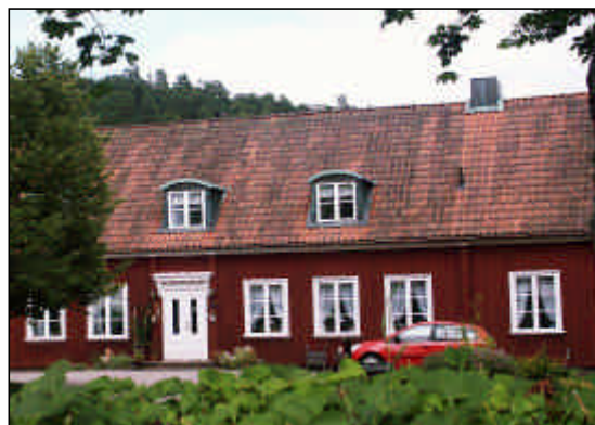
Västra Tunhems prästgård.