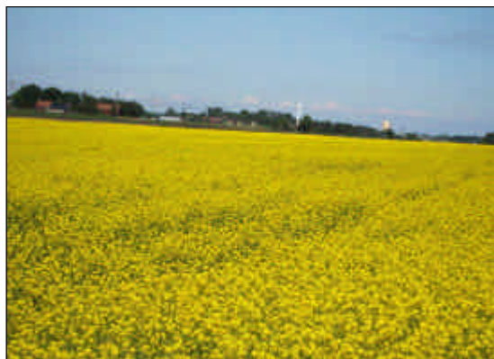
Rapsfält vid Nuntorp, Brälanda.

Jordbruksmark är av nationellt intresse och brukningsvärd jordbruksmark får tas i anspråk för bebyggelse eller anläggningar endast om det behövs för att tillgodose väsentliga samhällsintressen och detta behov inte kan tillgodoses på ett från allmän synpunkt tillfredsställande sätt genom att annan mark tas i anspråk (miljöbalkens hushållningsbestämmelser). Dalboslätten och slättmarkerna kring Västra Tunhem tillhör Sveriges mest bördiga jordbruksområden och