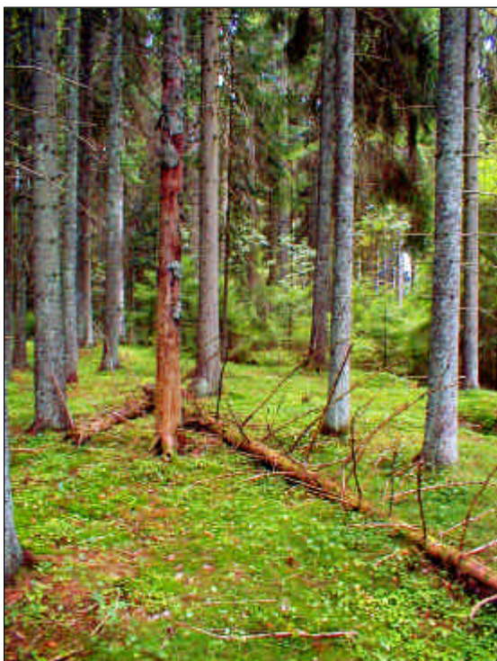
Tätortsnära skog i Dalbobergen.

Jakten har stor betydelse som fritidsaktivitet för många kommuninvånare. Den ger även markägare inkomster i form av jaktarrende eller vilt. Vårt kanske viktigaste område för jakt är Halle och Hunneberg som varit jaktområde för kungligheter sedan 1500-talet. Det är viktigt att goda viltstammar finns och förvaltas väl.