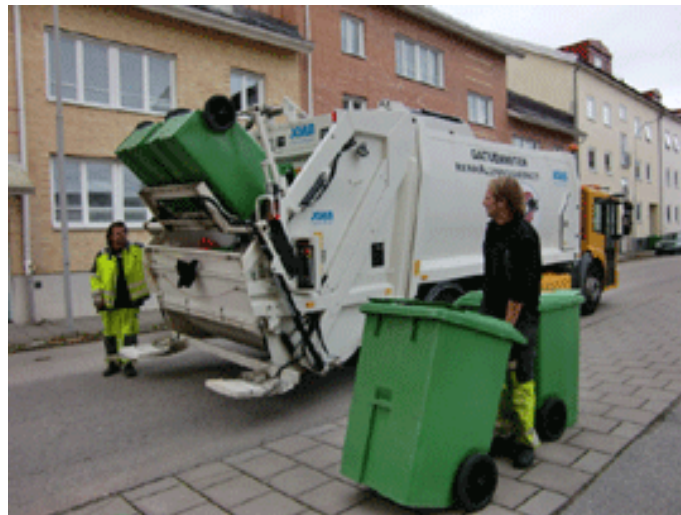
Avfallshämtning på Nygatan i Vänersborg

Antagen av kommunfullmäktige den 2012-06-20, § 83