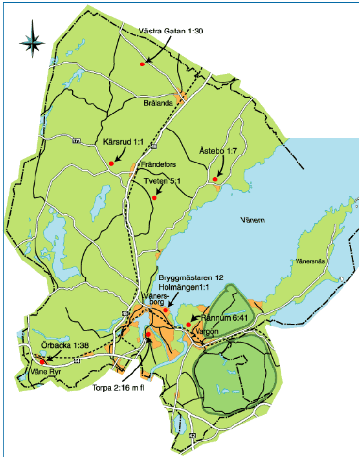
Figur 5.1 Nedlagda deponier i Vänersborgs kommun